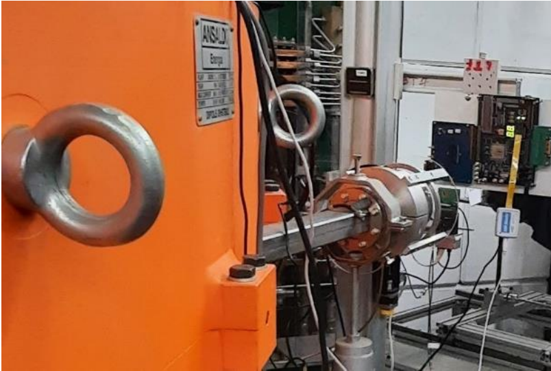
Figura 1: set up sperimentale eseguito nella BTF che mostra la configurazione durante uno dei cicli di misura