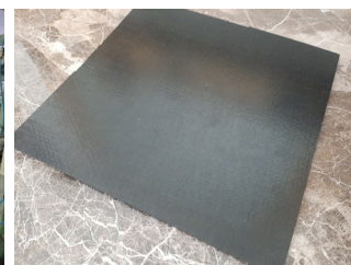
Lastra in fibra di carbonio realizzata dallo stampaggio dei tessuti EcoCarbonio